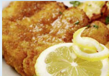
Seelachsfilet paniert mit Kartoffelsalat

Unsere Fischspezialisten backen für Sie frisch: