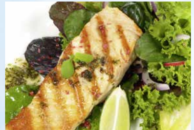
Salatteller mit gegrillten Lachsstreifen