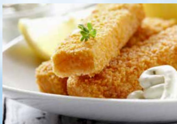
Nemo-Teller Fischstäbchen mit Pommes