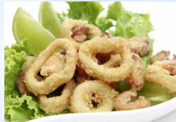
Tintenfischringe paniert mit Knobi