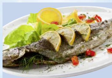
Frisch geräucherte Forellen aus der Region